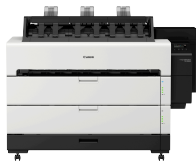
Canon imagePROGRAF TZ-30000