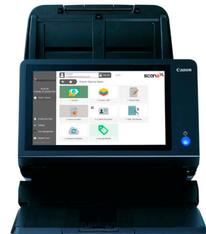
Scan2x avec ScanFront