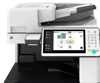
Scan2x avec imageRUNNER