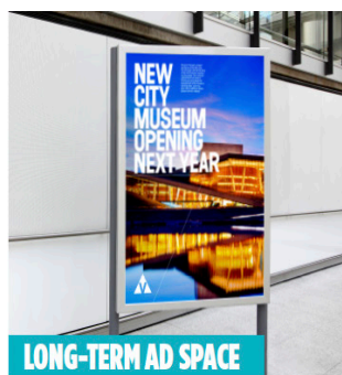
LONG-TERM AD SPACE