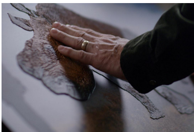
Eines der Ausstellungsmotive von Fotojournalist Brent Stirton: Die Hauttextur eines Nashorns wurde fühlbar nachempfunden. Auch für sehende Menschen eine interessante Erfahrung.