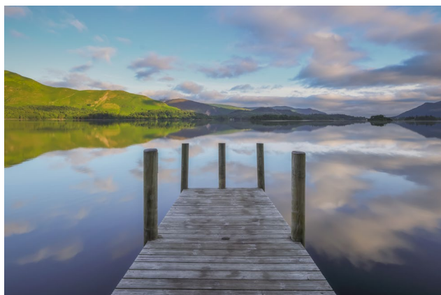
Derwent Water de Verity Milligan

Le concours photo Canon Redline Challenge, de retour pour sa troisième édition.