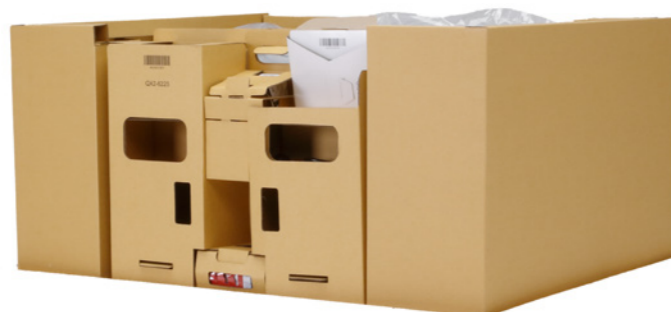
Embalaje sin EPS para la serie TM