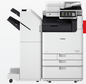
iR-ADV DX C5800