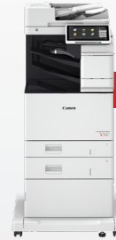
iR-ADV DX C478