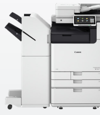
iR-ADV DX 6800