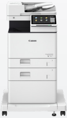
iR-ADV DX 717/617/527