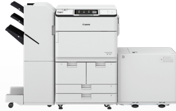
iR-ADV DX 8700