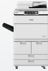
iR-ADV DX 6780i