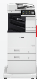
iR-ADV DX C478