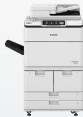
iR-ADV DX 6780i