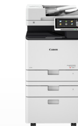
iR-ADV DX C257/C357