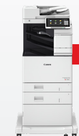
iR-ADV DX C478