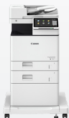
iR-ADV DX 717/617/527