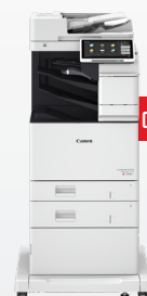
iR-ADV DX C478