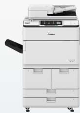
iR-ADV DX 6780i