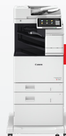
iR-ADV DX C478