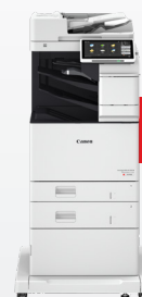
iR-ADV DX C478