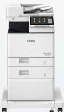
iR-ADV DX 717/617/527