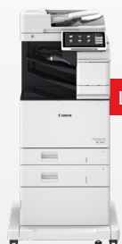
iR-ADV DX C478