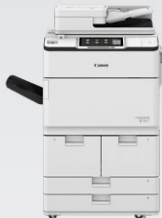
iR-ADV DX 6780i