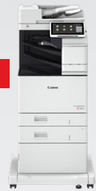
iR-ADV DX C478