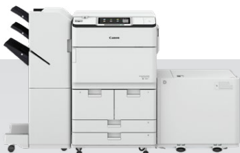
iR-ADV DX 8700

הטכנולוגיה ניצבת בבסיסו של סגנון עבודה 'היברידי' זה. כל ארגון עובר מסע של שינוי דיגיטלי שיאפשר לעובדים לעבוד, להתחבר ולשתף פעולה מכל מקום שבו הם נמצאים.