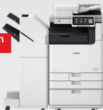
iR-ADV DX 6800