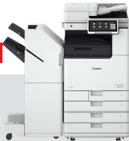
iR-ADV DX C3800