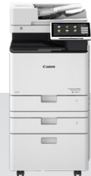
iR-ADV DX C257/C357