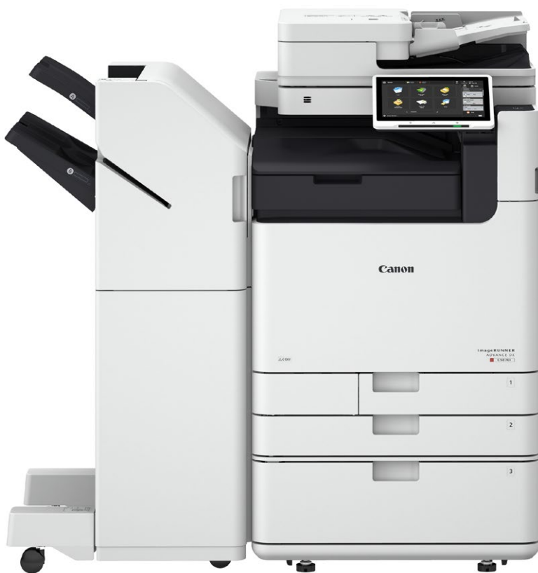
iR ADV DX C5800

סדרת המדפסות המשולבות החדשה imageRUNNER ADVANCE C5800 מפיקה עד 18% פחות פחמן דו-חמצני והיא שוקלת 20% בהשוואה לדור הקודם שלה.