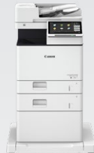
iR-ADV DX 717/617/527