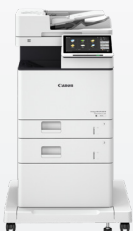
iR-ADV DX 717/617/527