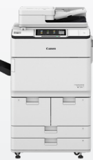
iR-ADV DX 6780i