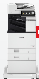
iR-ADV DX C478