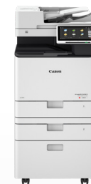
iR-ADV DX C257/C357