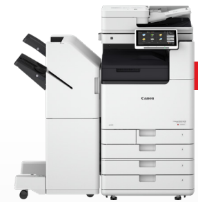
iR-ADV DX C3800