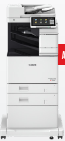
iR-ADV DX C478