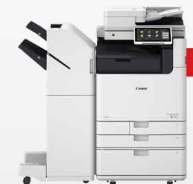
iR-ADV DX C5800