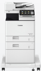
iR-ADV DX 717/617/527