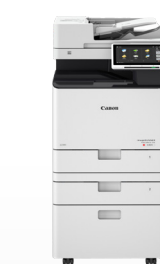
iR-ADV DX C257/C357