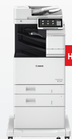
iR-ADV DX C478