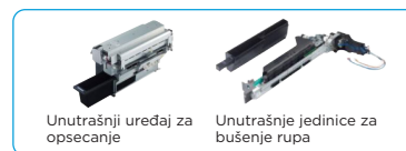
Unutrašnji uređaj za opsecanje