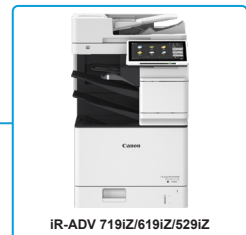
הצבה על שולחן העבודה עם יחידת גימור מבנית

מינטי מבוסס-מכשיר בענן להדפסת מסמכים ולניהול סריקות