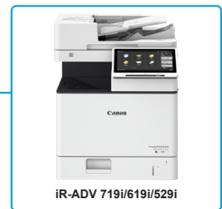
הצבה על שולחן העבודה ללא יחידת גימור