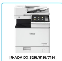
iR-ADV DX 529i/619i/719i DESKTOP-SYSTEM OHNE FINISHER