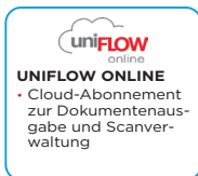
UNIFLOW ONLINE • Cloud-Abonnement zur Dokumentenausgabe und Scanverwaltung