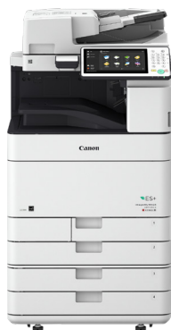
IR ADV C5560i ES+