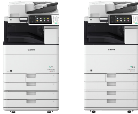
iR-ADV C5560i ES+ II