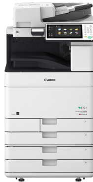
iR-ADV C5560i ES+ II