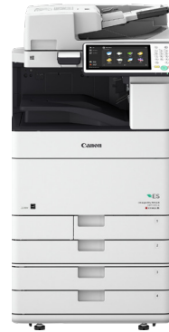
iR-ADV C5540i ES+ II