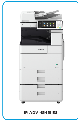
iR ADV 4545i ES