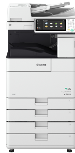
iR ADV 4545i ES

תצורה זו היא למטרת המחשה בלבד. לקבלת רשימה מלאה של אפשרויות והתאימות המדויקת שלהן למצורים, עיין בכלי המקוון להגדרת תצורה של מצורים.