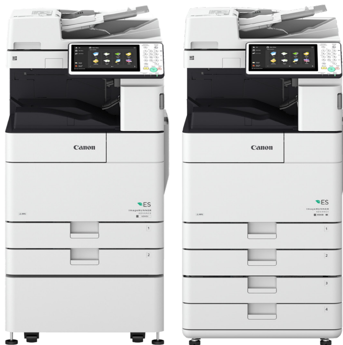
imageRUNNER ADVANCE 4525i ES II