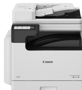
„iR 2425i II“