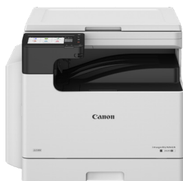
„iR 2425 II“