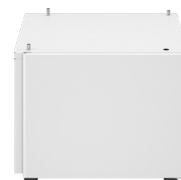
HLADKÝ PODSTAVEC J-2 • Slúži na zvýšenie zariadenia bez rozšírenia o ďalšie médiá

Táto plochá konfigurácia slúži iba na ilustračné účely. Kompletný zoznam ponúkaných možností a presné informácie o kompatibilitě nájdete v online nástroji na konfiguráciu produktov alebo sa obráťte na svojho obchodného zástupcu.