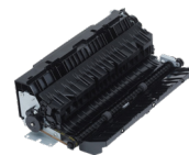
Единица за двострано печатење-Е1