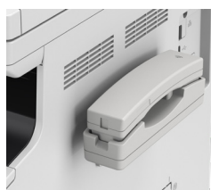
Handset-K1 kézi beszélő