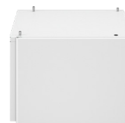
SOCLE TYPE J-2