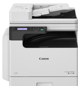
iR 2224iF II