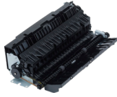
وحدة الطباعة على الوجهين F-1