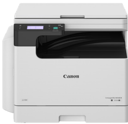
iR 2224 II