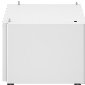
قاعدة الورق العادي من النوع J-2