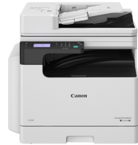
iR 2224iF II