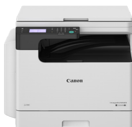
iR 2224N II