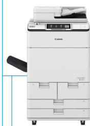
IR ADV DX C7765i/ C7701/C7780i