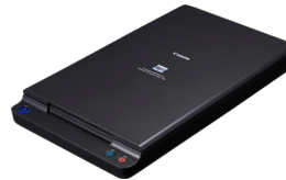
Položena jedinica za A4 skeniranje 102