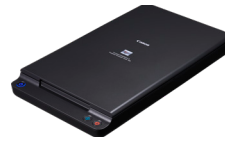
Единица за скенирање 102 со рамно лежиште за A4-формати

* Брзината на скенирање зависи од спецификациите на компјутерот и поставените функции. Посетете го веб-сајтот на Canon за повеќе информации.