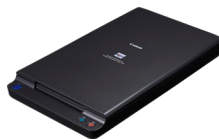
Položena jedinica za A4 skeniranje 102

Posetite Canon veb stranicu za više informacija.