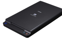
Unitate de scanare cu suport plat A4 102