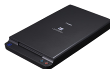
Piano di scansione A4 Flatbed 102