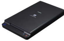
יחידת סורק שטוח 202 לגודל A3