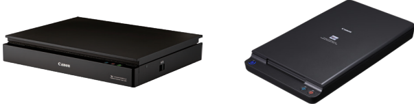
יחידת סורק שטוח 202 לגודל A3