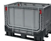
Die Rote Box COLLICO 121×81×90 cm – 825l wetterfeste Faltbox