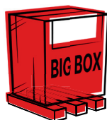
Die Rote Box „Big Box“ 120×80×110 cm – 1056l