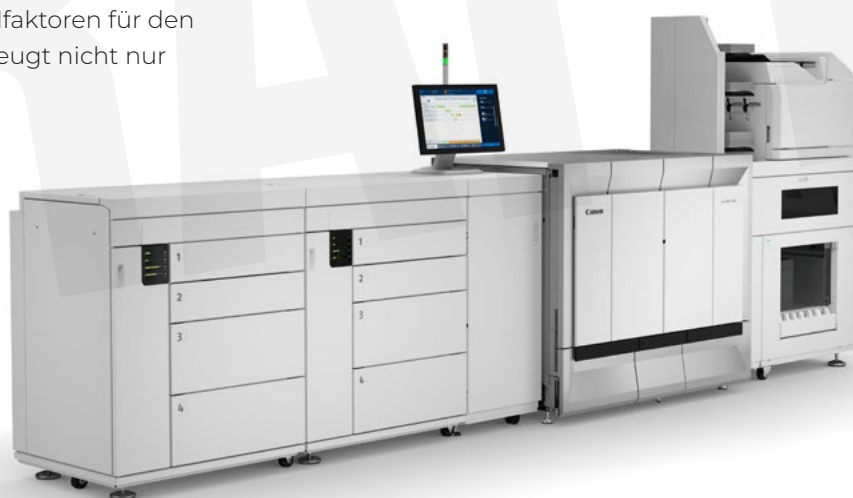
varioPRINT 6000 TITAN

durch innovative Technologie, sondern auch durch umfassende Beratung, individuelle Lösungen und eine enge Zusammenarbeit auf Augenhöhe. So kann Pustet seinen Kunden heute ein noch breiteres Portfolio, maximale Flexibilität und konstant hohe Qualität bieten – und ist bestens gerüstet, um die Chancen der digitalen Transformation aktiv zu nutzen.