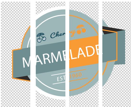
Original Weißmaske Lackmaske Beschnitt

Vom Auftragseingang bis zum Druck und der Verarbeitung bietet die Software maximale Transparenz und Zuverlässigkeit für alle Produktionsschritte. So können Sie sich auf einen fehlerfreien, schnellen Druckprozess verlassen – mit einem qualitativ hochwertigen Resultat.