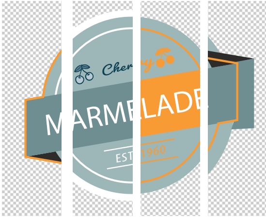
Original Weißmaske Lackmaske Beschnitt