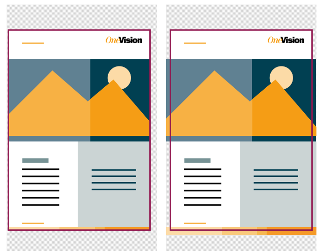
Druckdatei wird ohne Beschnitt geliefert.

Die Book Automation Suite ist eine sogenannte Middleware, die sich mit oder ohne Verwendung des Benutzer-Interface nahtlos in Ihre bestehende System- und Maschinenlandschaft integriert. Der Import von Produktionsdaten erfolgt entweder direkt oder über eine Schnittstelle zu Drittsystemen, Management-Informationssystemen (MIS), Enterprise-Resource-Planning-Systemen (ERP), Webshops oder anderen Systemen. Das Resultat: Ihre High-Speed-Druckmaschinen arbeiten perfekt und reibungslos mit MIS und Bindesystemen zusammen.