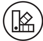
PROFESSIONEL PRINT - FARVERÅDGIVNINGSSERVICES