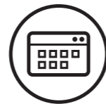
PROFESSIONELT PRINT - SOFTWAREOPLÆRINGSSERVICES