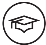
AVANCERET OPLÆRING I OPERATØRVEDLIGEHOLDELSE