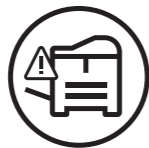
PROFESSIONELT PRINT - PRINTEROPLÆRINGSSERVICES