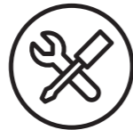
VEDLIGEHOLDELSE OG SUPPORT AF ENHEDER