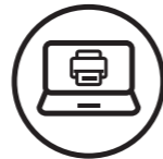
SUPPORT TIL PRINTERCONTROLLER