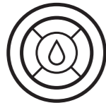
PROFESSIONELT PRINT - FARVESTYRING OG OPLÆRINGSSERVICES