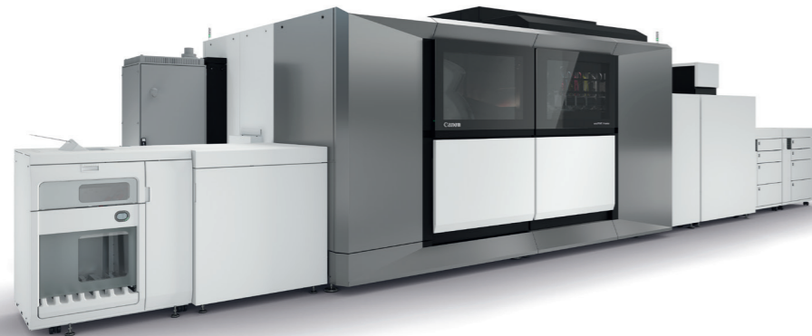
Струйная печатная машина с листовой подачей Canon varioPRINT iX3200

В зависимости от объема и типа задания выбор нескольких тонерных печатных машин может стать оптимальным — они предлагают многие преимущества, аналогичные офсетным устройствам, однако поддерживают печать переменных данных и по запросу благодаря цифровым технологиям печати. Технология производственной струйной печати находится в промежутке между цифровой тонерной и офсетной — она открывает новые возможности тем, кто использует офсетные печатные машины, и позволяет печатать переменные данные для персонализации и пакетной кастомизации. Теперь давайте более подробно рассмотрим производственную струйную печать.