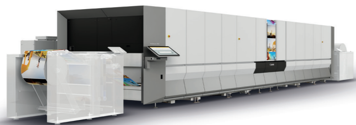
Серия Canon ProStream 2000

Производители струйных печатных машин работают совместно с производителями бумаги, чтобы обеспечить поддержку широкого ряда носителей устройствами струйной печати, и применяют для этого несколько методов. Сольвент Canon ColorGrip используется как в рулонных (ProStream), так и листовых (серия varioPRINT iX) печатных машинах — он обеспечивает высокое качество печати на бумаге, не подготовленной к струйной печати, благодаря чему носители с покрытием и без, используемые для офсетной печати, можно использовать для печати материалов почтовой рассылки, книг, руководств и образовательных материалов.