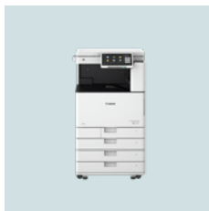
imageRUNNER ADVANCE DX C3700-serien