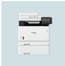
i-SENSYS X C1127i-serien C1127iF 27 sider per minutt C1127i 27 sider per minutt