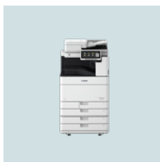
imageRUNNER ADVANCE DX 6000i