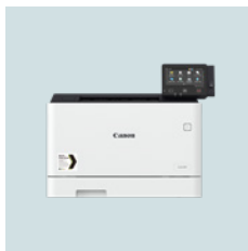
i-SENSYS X C1127P C1127P 27 sider per minutt