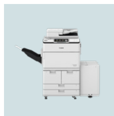
imageRUNNER ADVANCE DX 6700-serien