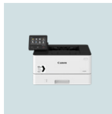
i-SENSYS X 1238P 1238P 38 sider per minutt