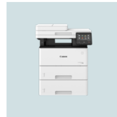
imageRUNNER 1643i-serien 1643iF 43 sider per minutt 1643i 43 sider per minutt