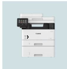
i-SENSYS X 1238i-serien 1238iF 38 sider per minutt 1238i 38 sider per minutt