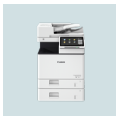
imageRUNNER ADVANCE DX 527-/617-/717-serien