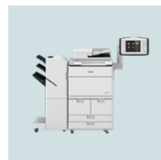
imageRUNNER ADVANCE DX 8700-serien