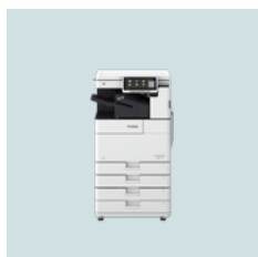
imageRUNNER ADVANCE DX 4700-serien