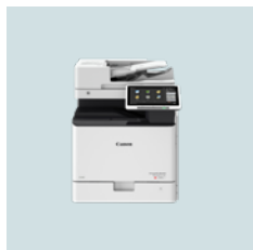
imageRUNNER ADVANCE DX C257-/C357-serien