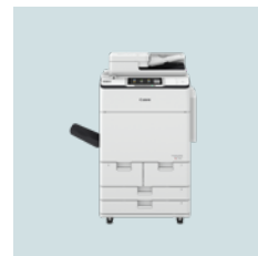
imageRUNNER ADVANCE DX C7700-serien